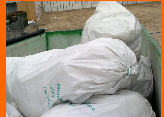
Containerstellung für Mineralwolle