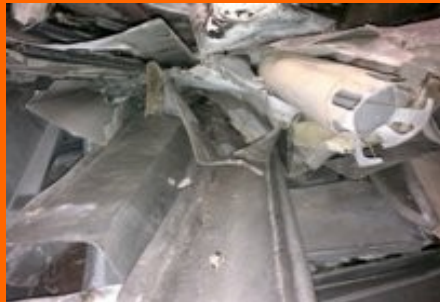
Reststoffe aus der Bauwirtschaft