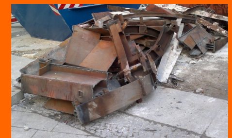
Verwertungstoffe aus Industrierückbau