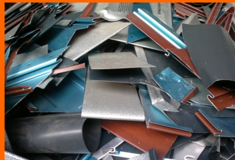
Abfälle des verarbeitenden Gewerbes