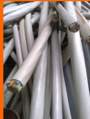
Kabelabfälle aus Infrastrukturrückbau